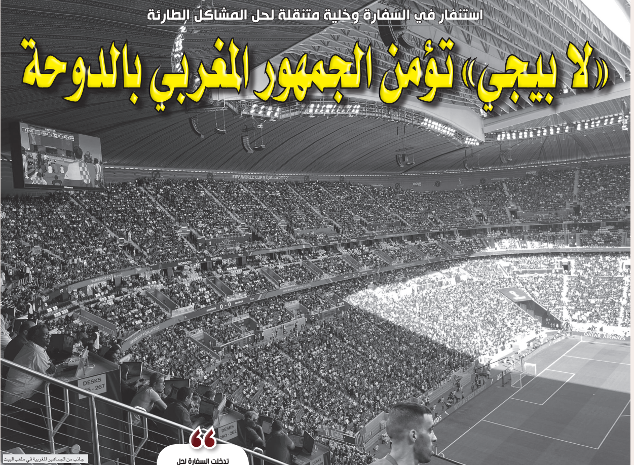
جانب من الجماهير المغربية في ملعب البيت