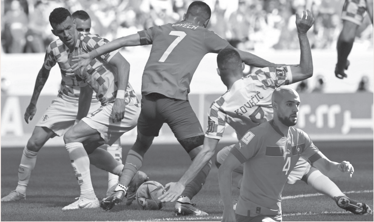
بداية جيدة للأسود بالمونديال

وقبل نهاية المباراة بدقائق قليلة أعلن مذبح ملعب البيت عن نسبة حضور قياسية في المدرجات بعدما وصل عدد المشجعين الذين تابعوا مباراة الأمس إلى 59 ألفا و 104 متفرجين، أغلبيهم كانوا من أنصار الفريق الوطني بينما لم يتجاوز عدد أنصار الفريق الكرواتي 3000 مشجع على أكثر تقدير. وتنتظر الفريق الوطني يوم 27 نونبر الجاري مباراة لا تقل صعوبة عن مباراة الأمس ضد كرواتيا، حيث سيصطدم هذه المرة بالمنتخب البلجيكي المحتل للمصنف الثاني في التصنيف الدولي للمنتخبات الصادر عن الاتحاد الدولي لكرة القدم فيفا، وهي المباراة التي سيكون ملعب التمامة مسرحا لها.