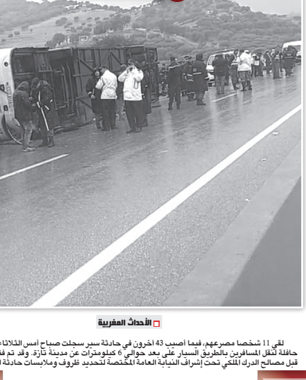
لقى 11 شخصاً مصرعهم، فيما أصيب 43 آخرون في حادثة سير سجلت صباح أمس الثلاثاء، إثر انقلاب حافلة لتقل المسافرين بالطريق السيار بعد حوالي 6 كيلومترات من مدينة تازة. وقد تم فتح بحث من قبل مصالح الدرك الملكي تحت إشراف النيابة العامة المختصة لتحديد ظروف وملابسات حادثة السير هذه.