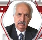
السيد: محمد البريني مدير النشر: المختار لغزوي