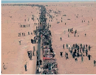
تأليف يوميا مخزنة باهم دهم المملكة، ومعدة لنقلها إلى عين المكان 12 ما كان هناك نقص ما في التغذية، حيث تم تخصيص 1700 طن يوميا من الخبز، والخبز، و6300 طن من المياه و2590 طن من الوقود.

وعلى بعد كيلومترات قليلة من أكادير بسفيل المرضى داخل خيام مع إدارية في حين الإحالة والحالة أو الشفاء، كما إن سعة المستشفيات الخمسة المتاخمة 745 سريراً، مع طاقم طبي مكون من 27 طبيبا ضمنهم 12، المصيرالينون 3، مساعدين طبيين مخبرين، الجراحون 12، مساعدين طبيين عامين 44، مساعدين طبيين عامين 82، مساعدين تقنيين 45، أطباء الأوبئة 12، موفو التشخيص 8، مساعدين طبيين 8000 عدد العودة، وتوزع الأراض بين الاضطرابات في الجهات البوصية، ضربات الشمس، الصواع، الأم أسفل الظهر وغيرها مما يتعلق بمعاناة النقل وطول السفر.