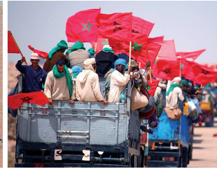
تأليف يوميا مخزنة باهم دهم المملكة، ومعدة لنقلها إلى عين المكان 12 ما كان هناك نقص ما في التغذية، حيث تم تخصيص 1700 طن يوميا من الخبز، والخبز، و6300 طن من المياه و2590 طن من الوقود.

استراتيجية التغطية الصحية للمتطوعين تم وضع استراتيجية العمل مشتركة لفخيلة الصحة العمومية الخاصة بالمتطوعين، تحت إشراف الوزارة ومقشبية مصالح الصحة