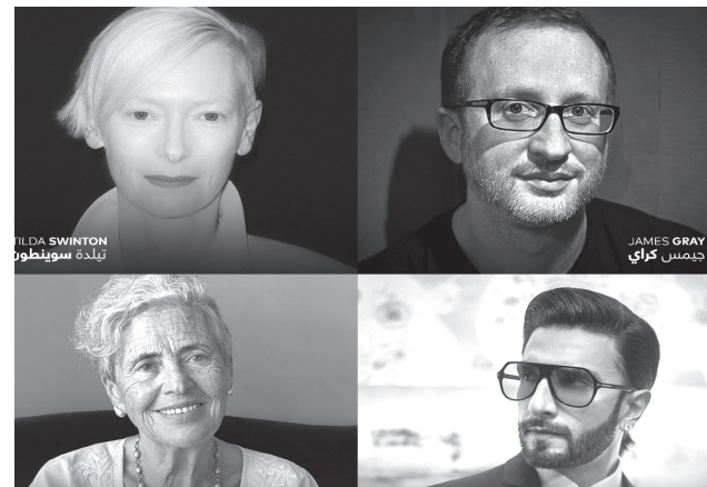
HILDA SWINTON، تيلدا سوينطون، JAMES GRAY، جيمس جراي