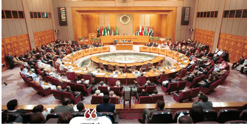
قمة عربية سابقة