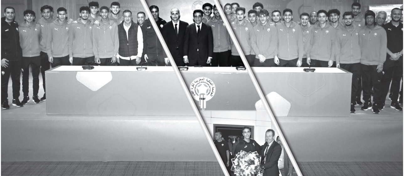
جانب من حفل الاستقبال الذي حظي به منتخب الفتيان

بودلال، عميد المنتخب الوطني، بالدعم الكبير الذي يقدمه الملك محمد السادس للرياضة المغربية عموما وكرة القدم على وجه الخصوص. كما أشاد بالعمل الذي يقوم به فوزي لقجع رئيس الجامعة الملكية المغربية لصالح كرة القدم الوطنية، وكذا توفيره للخدمة الوطنية جميع شروط النجاح.