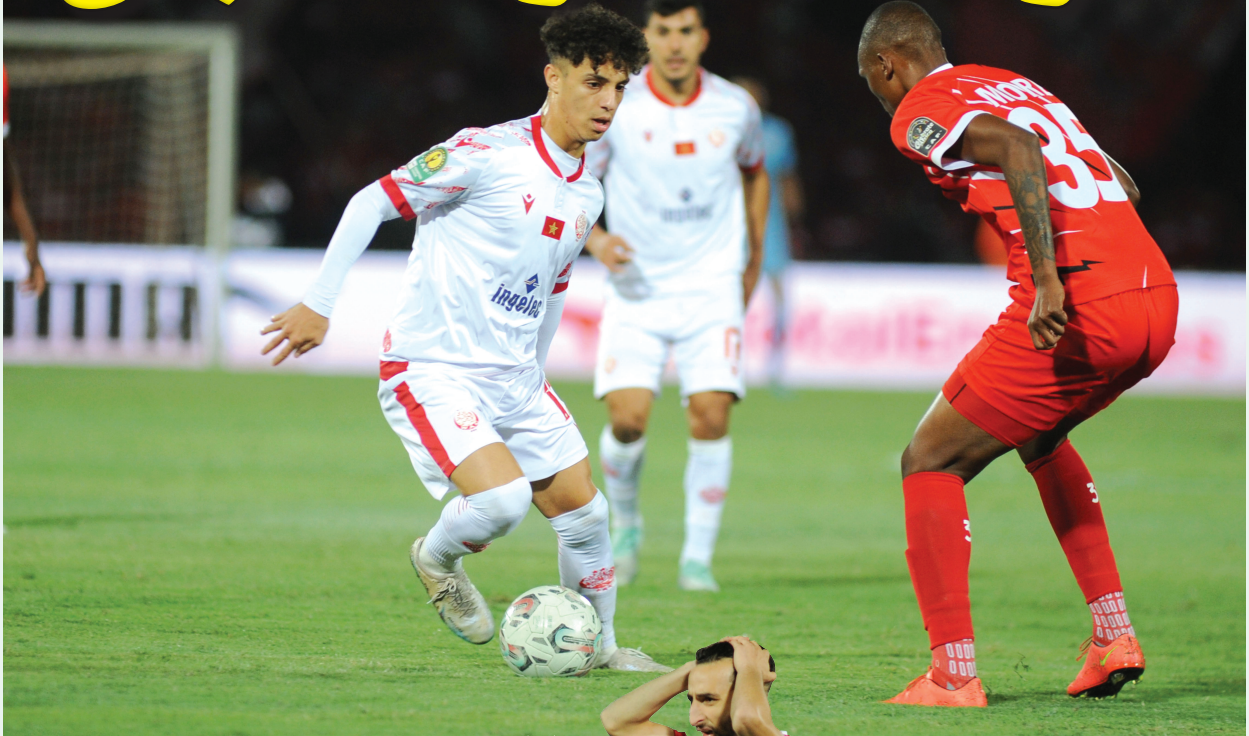
الوداد ظهر بصورة متواضعة في مباراته ضد غالاكسي البوتسواني