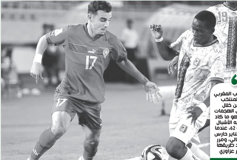
المنتخب الوطني قدم أداء جيدا بمونديال اندونيسيا

انهزم المنتخب المغربي لاقبل من 17 سنة، أمام نظيره المالي بهدف للأشعة، في المباراة التي جمعت بينهما أول أمس السبت، على أرضية ملعب ماناهان بيسواكارا باندونيسيا، برسم ربع نهاية كأس العالم. وتوقفت مسيرة المنتخب الوطني للفتيان في ربع نهائي المونديال بخسارة ضد مالي بهدف لصفر في إحصاءات التي قدم خلالها أداء جيدا، وكان بقليل من التركيز قريبا من حسم النتيجة لمصلحته لولا التسرع الذي طبع أداء المهاجمين، خصوصا في الشوط الثاني.