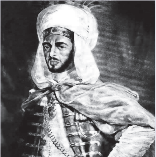
السلطان أحمد المنصور الذهبي

تأسست أولى شرارة على الإطلاق بين بريطانيا والمغرب، إذ كان دولا في الشرق لم تقبل كيف إن دولة عنون مثل بريطانيا تعامل المغرب ندا للند، وتؤسس لعلاقات تجارية معه، في وقت كان الوندل في دول أخرى نظرة استعمارية.