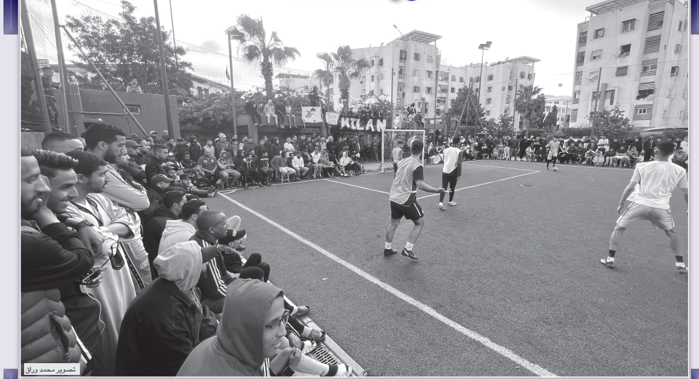
دوريات رمضان الكروية. هي ليست مباريات في كرة القدم فقط، بل تجمعا جماهيريا وصالحة رحم بملاع الأحياء يحج إليها العديد من عشاق المستديرة وبناءه القدامى الذين اختاروا أحياء أخرى للسكن ومناخها حاتمها. إلا أن دوريات رمضان تشكل مناسبة لهم لربط الصلة بالماضي، واستعادة ذكريات الزمن الجميل. بعض هذه الملاعب تشكلت في السنوات الماضية، مشددا للاجئين وكانت عين القناصة لطلاب المخرجين لإنتاجهم بعض الأندية. المستديرة سحر خاص وهذه الملاعب تجاوزت السحر لتصبح «زاوية» تحضن كل المريدن. في الصورة ملعب درب بالان البيضاء الشهير باسم «بيتك»