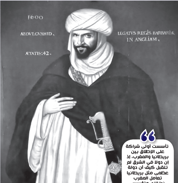
لوحة حقيعية للسفير عبد الواحد بن عنون

بضعة آلاف من الأندلسيين كي تلجأ إليهم لطلب الحماية، لا شك أن تلك المقرحات صدمت السلطان الشريف فأسرع بإرسال موفد من أصل أندلسي إلى لندن في نهاية 1601 محملا برسالة تؤكد فيها أن جميع الموانئ المغربية ستبقى مفتوحة للتجار الأجانب، وبمحافظة هؤلاء على جميع الاتفاقيات والتفاهات الخاصة بهم. لم يندد على أن المملكة إسبانيا تغني قوتها جدا ولن يكون لإطاحة أميرها سهلا ذلك كان لا بد من الأعداد الجند لذلك الهجوم، لذلك فإن إرسال أندلسيين لمثل هذه الغرض هو بمثابة تحدي عسكري، ذلك المهنة تقترض، بحسب رايه، تجنيد حوالي مائة ألف جندي محترف وسلاحين شتى، ورغم ما يتخلفه ذلك من كلفة باهظة فإن السلطان الشريف يعلن عن استعداده للتكفل بجميع تلك المصاريف بشرط: كل الأراضي المفتوحة جوار إليه حصرا، لأن العلماء سيقضون في حالة مخالفة شدة هم الناس للزور إلى الجهاد.