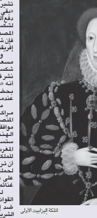
للكة البرابنتية الأولى

كان لا بد من تأمين المراسلات السلطانية حفاظا لأسرار المعلن، ونظام الترميز أعيد استعماله من قبل أحمد المنصور، ولعل السلطان ورجاله قد استفادوا من تجارب الدول الغربية، والى أن كان هذا ال عثمان والأسبان، والإيطاليين، كان قسم الترميز تحت إمرة عبد الواحد بن عنون، حيث خبثا تقويم إيجليزي أن عبد الواحد بن عنون كان يتمتع بحظوة كبيرة في البلاط، فظفرا لكثافة وخبثاته في الكتابة فقد كان عبد الواحد يتكلم الإسبانية، ويمتلك بعض المبادئ من علم الفلك وعلم التنجيم وهو حافظ يقري، ولا بد أن معرفة الخطية والسلمانية قد مكنته من الاستفادة من مساعدين مغاربة في الترميز تحت إمرة عبد الواحد بن عنون، واجتنب لوضع نظام ترميز أصيل، رغم بساطته. مختلف المصادر تؤكد أن السلطان كان يتوفر بطبيعة الحال على قسم للترميز وآخر لفقه، إذ كان لا بد من فة رموز الرسائل والرقاقات والتقاير المكتوبة باللغات الأوروبية التي يقع اعتراضها من قبل السلطات المغربية. فأسفراء التجسس والجواسيس الأوروبيون الذين كانوا المئات من الرسائل والتقارير الرسمية إلى حكوماتهم كانوا يرسلون في الكثير من الأوقات رسائلهم وتقاريرهم. بعدنا عن الرسومات عرض الوفد المغربي فقرحات السلطان الشريف، ويفضل المفكره التي أعدتها الحكومة الإنجليزية يوم 23 شتنبر 1600، فإنه يمكننا إعادة رسم ملاح المقرحات التي فدتها شقوبا عبد الواحد عنون، تمتلك السلطنة الشريفة موقعا استراتيجيا يمكن أن