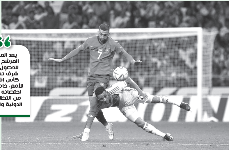
لجنة الكاف تابعت مباراة المغرب والبرازيل من منبرجات ملعب خنفة

وصدروا أثناء زيارتهم للمب تبليسون مابندلا، حيث وجوه لا يستحب لبسط الشروط لأحضان مباريات الكان، وقد أظهر شريط فيديو أحد أعضاء اللجنة، وهو في حالة اندهاش عندما فتح باب إحدى المداخل، حيث سرعان ما أغلقه، معبرا عن استيائه من الحالة التي وجد عليها ذلك المرحاض.. كما أن حثفجات المياه في ذات المرحاض وجدوا فيها ماء بائساية ضعيفة، وأخرى لا يوجد بها ماء بالمرة. وعند تفقد اللجنة للطرق المؤدية للملعب، وجدوها مكشوفة، ويصعب التنقل فيها بسلاسة، كما لاحظوا كثرة الممارجات، الأمتنة، مما ينتج عنه ازدحام أثناء المرون. وتجدر الإشارة إلى أن الكاف سحب نسخة 2025 لكأس أفريقيا، لعدم استجابتها للمعايير المحددة وتأخر تنفيذ مختلف المشاريع، ما يهدد نجاح البطولة، خاصة بعد الأزمات التي أحدثت خلال النسخة الأخيرة في الكاميرون.