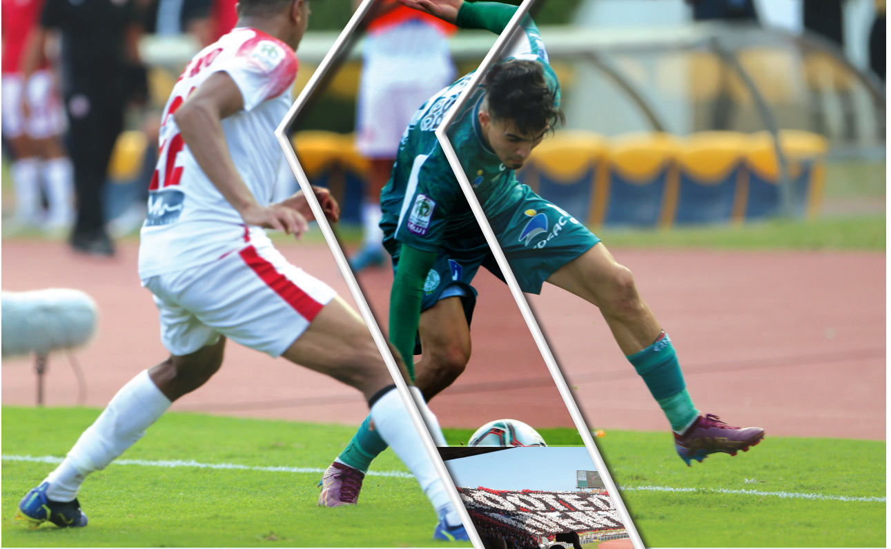
الوداد والرجاء يراهنان على الفوز في الديربي لتحسين موقعيهما

الوطني للتجارب والدراسات لتحديد سبب الإهتزازات، التي تشهدها المنطقة المتحركة عند تحرك الجماهير في المدرجات، مما أثار العديد من المخاوف حول احتمال انهيارها. ونص الاتفاق على طبع 2200 تذكرة لجماهير الرجاء الرياضي وطرحتها للبيع، لتتصاف إلى 16.500 مقعد محزون لأصحاب بطائق الاشتراك، مقابل طبع 18.200 تذكرة وطرحتها للبيع لفائدة جماهير الوداد الرياضي، تتضمن 6000 تذكرة مخصصة للمنطقة 6، رغم استمرار إغلاقها، حيث سيتم تعويض خسارة الذهاب بنتيجة 1-2. إذ كانت مباراة الثالثة تقطع مع الفريق خلفا لمواطنه فوزي البنزرتي. وسبق أن صرح الكبير بأنه يأمل بتدوين اسمه ضمن اللذين التوسمين الذين فازوا في الديربي الغربي، ويتصدرهم فوزي البنزرتي، أما خوان كارلوس غاروي، مدرب الوداد، فقد حضر الديربي في ثلاث مناسبات قبل 5 أعوام، حين كان مدربا للرجاء، وحقق خسارة وتعادلا وفورا.