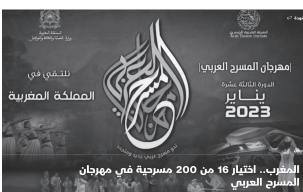
مهرجان المسرح العربي 2023 الدورة الثامنة عشر 16 من 16 من 200 مسرحية في مهرجان المسرح العربي

أعلنت الأمانة العامة للمهرجان العربية للمسرح، يوم الإثنين الأخير، عن اختيار 16 عرضا للمشاركة في الدورة الـ 13 للمهرجان المسرحي التي تقام في المغرب من 10 إلى 16 يناير 2023.