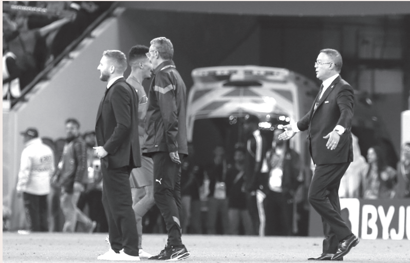
فرحة رئيس الجامعة بتأهل الأسود بنصف نهائي المونديال